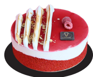
AMANDOISE Lait d'amande et framboise