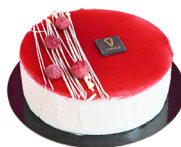
HARMONIE Vanille et framboise