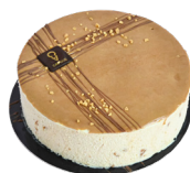
DOUCEUR Vanille et caramel salé