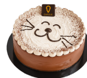
SULLY Vanille et chocolat