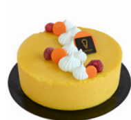
ÉVASION Passion-mangue et framboise