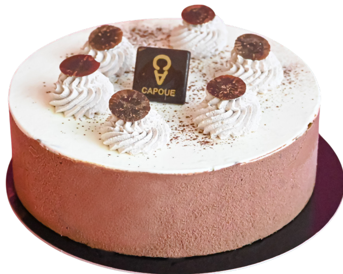
DAME BLANCHE Vanille et chocolat