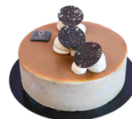
MANNEKE Vanille et spéculoos